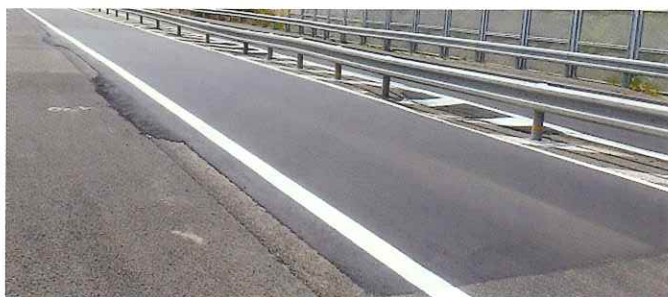
舗装補修後イメージ