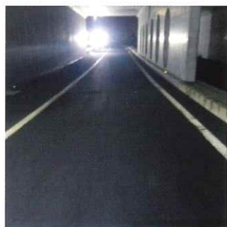
舗装補修後イメージ